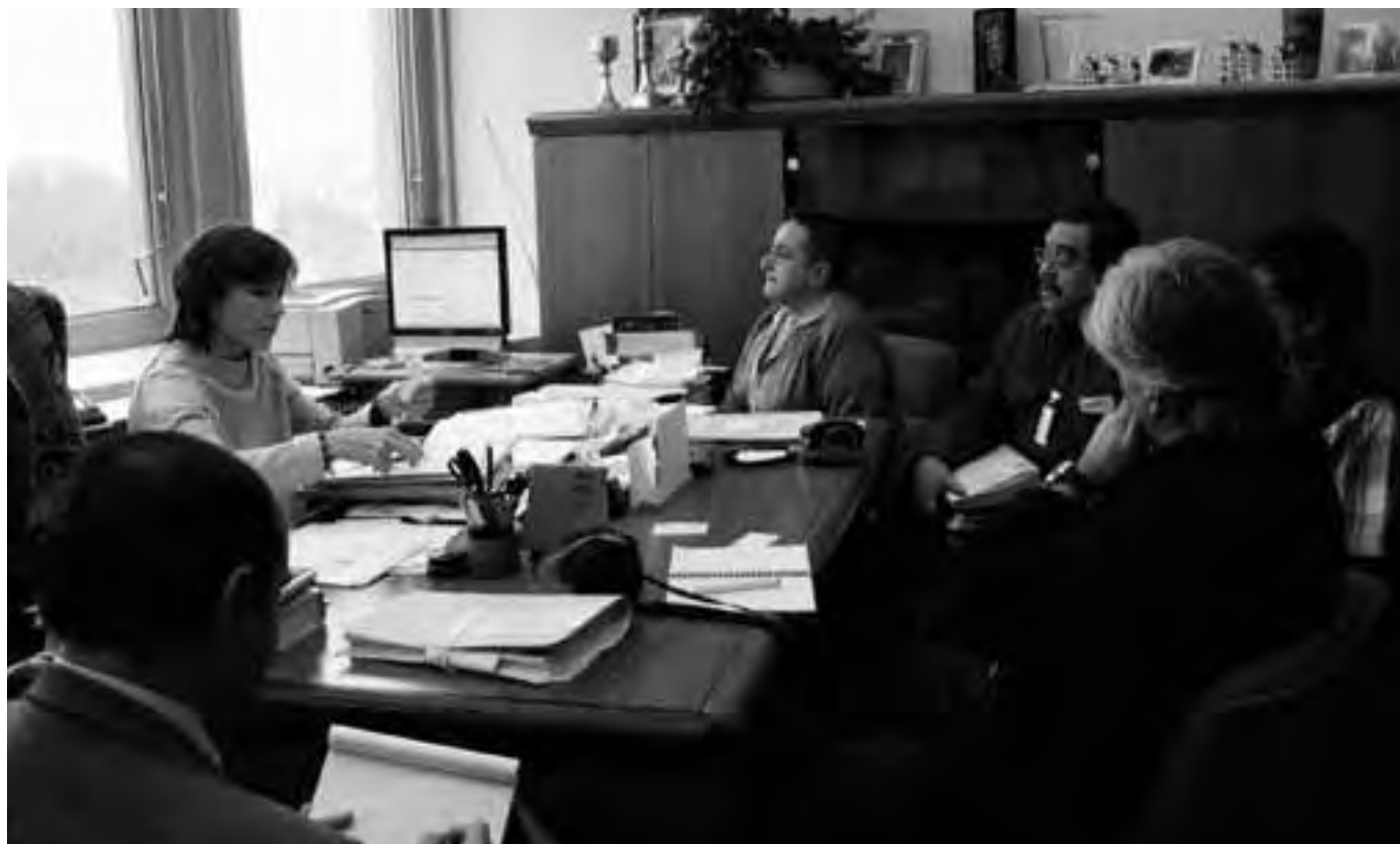
Noviembre de 2006. Dirigentes del SNTMMSRM presentaron pruebas de violación de la autonomía sindical a la Organización Internacional del Trabajo (OIT), en apoyo de una queja presentada a la Organización contra el gobierno de México el 30 de marzo de 2006.