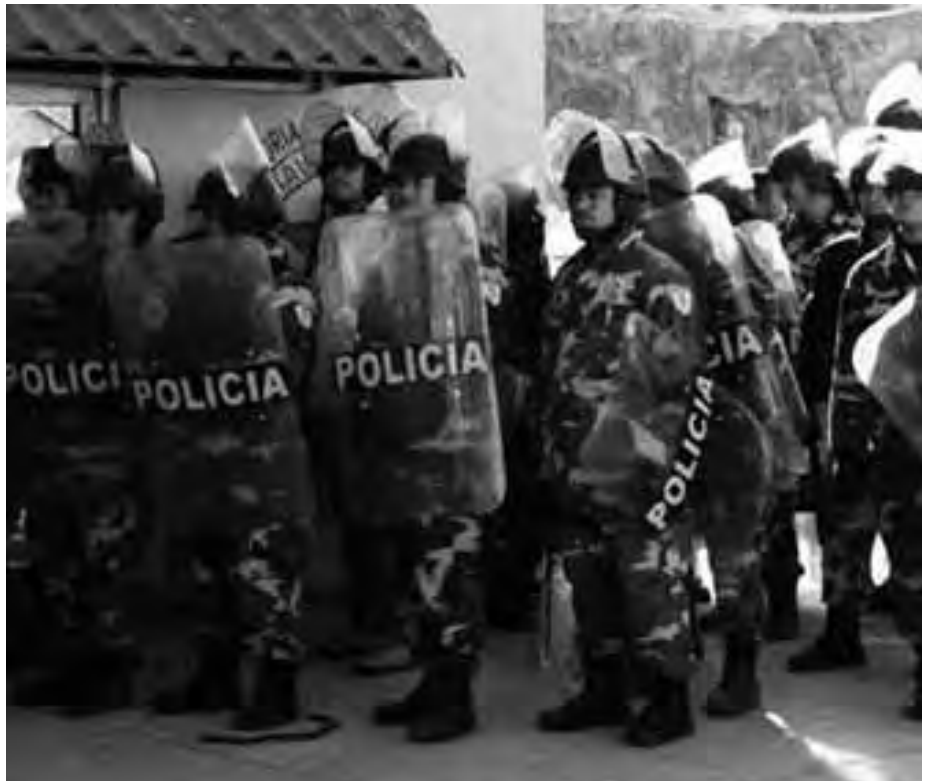
El 11 de enero de 2008, según informes recibidos, cerca de 700 agentes estatales y federales armados expulsaron a unos 1.500 mineros que estaban en huelga exigiendo mejoras en las protecciones de salud y seguridad en una mina de propiedad del Grupo México, en Cananea, Sonora, México.

En abril de 2007, la Secretaría del Trabajo y Previsión Social de México (STPS) realizó una inspección de dos días en la mina de Cananea y determinó 72 medidas correctivas, incluidas la instalación de colectores de polvo, reparación de frenos de grúas de mal funcionamiento, eliminación de peligros